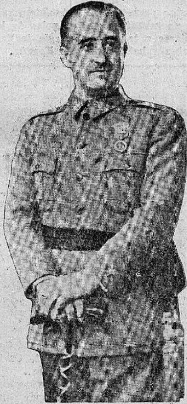
General FRANCISCO FRANCO

LONDRES, 21. UP. — Mensajes de prensa recibidos aquí de Lisboa y originados en Salamanca aseguran que las fuerzas nacionalistas ya se apoderaron de la estación de radio de Gijón. La resistencia de los milicianos se ha debilitado completamente y parece que sus últimas manifestaciones históricas están limitándose a la destrucción de puentes, caminos y edificios para impedir la inmediata persecución en fuerza por los nacionalistas. (PASA a la Página OCHO)