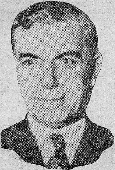
General FIDEL DAVILA